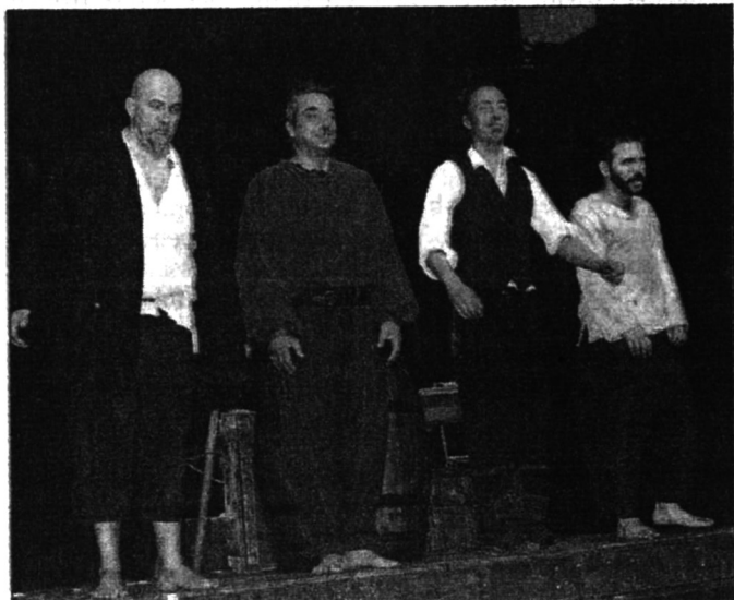
Un spectacle joué plus de 130 fois par les Ben'arts, applaudis sans retenue par des festivaliers conquis par leur jeu

l'accordéon et les complaintes de Philippe Leroy qui fait chanter le vent dans les cordages de l' Épervier . Fidèle au texte d'Eugène Sue, les Ben'arts rejouent « la mort d'un pourri », car le jour de son enterrement, scène irrésistible, Kernok, grand consommateur de poudre et de chair à canon pour assouvir sa cupidité, est loué par le prêtre, dans la plus parfaite hypocrisie. Le jugement d'une société fourbe qui punit le juste et rend hommage aux têtes brûlées. Une pièce drôle, sarcastique, parfaitement servie par la générosité de comédiens pour le moins explosifs applaudis à tout rompre à la fin de leur spectacle.